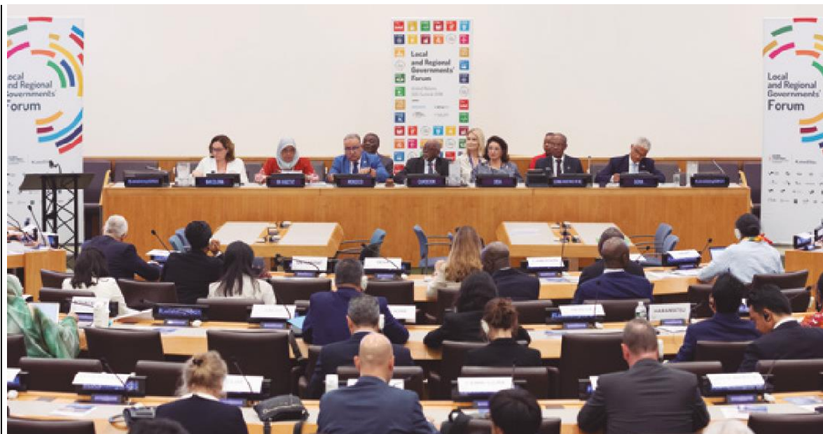
Форум местных и региональных властей, организованный Глобальной целевой группой в рамках Саммита ООН по ЦУР в Нью-Йорке 24 сентября 2019 г..