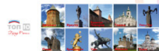
Рейтинг городов - результаты на 22-05-2012, 10:47

По предварительным данным лидирующую позицию занимает город-герой Смоленск, опережая почти на 10000 голосов Иркутск – своего основного «соперника». Третье место занимает Великий Новгород. В Топ 10 рейтинга лидирующих городов входят: Тюмень, Улан-Удэ, Псков, Красноярск, Уфа, Воронеж, Томск. Всего в конкурсе принимает участие 81 город. Проголосовать можно на сайте: http://город-россии.рф/