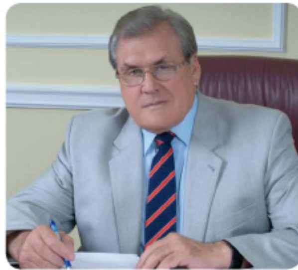
Глава города Оренбурга Ю.Н.Мищеряков. Mayor of Orenburg Yuri Mischeryakov.

(Interview of the Mayor of Orenburg Yuri Mischeryakov)